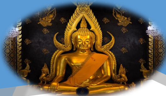
พระพุทธชินราชงามเลิศ